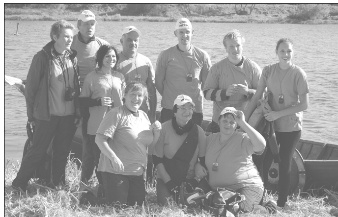
Mokytojai mokosi ir plaukti

Tęsimas Individualaus mokinių mobilumo projektas. Gimnazijoje tris mėnesius mokysis trys italai ir penki prancūzai.