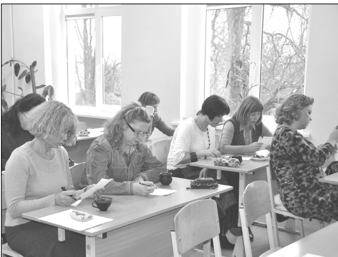
Patys daro namų darbus