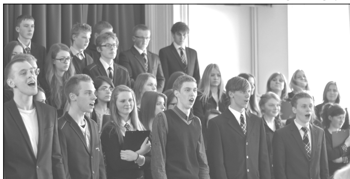
Mūsų dainos skirtos Jums, Mokytojai!