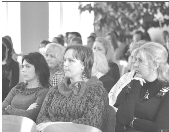
Mokytojai moka išklausti kitą