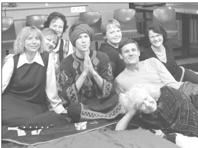
Mokytojai moka ir atsipalaiduoti