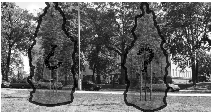
Metų praradimas – tujos.