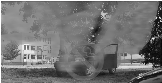
Metų atradimas – rūkstantys automobiliai.