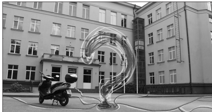
Jei abiturientai per laisvas pamokas nesirenka mokykloje, tai kur jie?