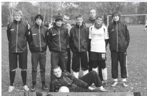
Spalio 22 d. vyko rajoninės futbolo varžybos „Rūdubio“ taurei laimėti. Nugalėjo gimnazijos vaikinai, merginų futbolo rinktinė užėmė II vietą.