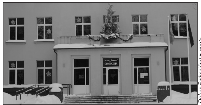
Dainos Peckevičiūtės nuotr.