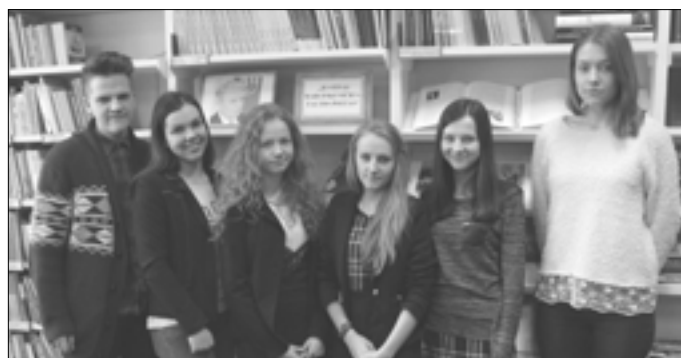
Gimnazistai – rajoninio skaitovų konkurso dalyviai