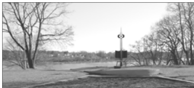
„Žiburio“ kalnelis, ant kurio stovėjo senoji „Žiburio“ gimnazija

Prienų „Žiburio“ gimnazijos lietuvių kalbos mokytojos