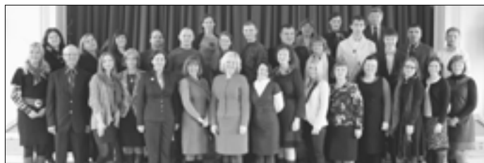
Gimnazijos diena – svečiai ir mokytojai