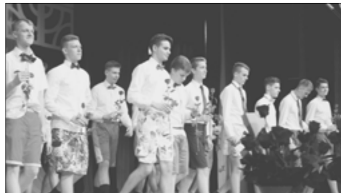
Abiturientų Šimtadienio akimirka

Mikalojus Daukša yra pasakęs: „Aš tiktai smerkiu mūsų gimtosios lietuvių kalbos apleidimą, kone išsižadėjimą ir bodėjimąsi ją. Duok Dieve, kad mes laiku apsidairytume ir iš to praradimo kada nors prisikeltume“. (...) Suprantama, kad visais laikais paaugliai vartoja slengą, vadinamąją jaunimo kalbą. Akivaizdu, kad nežengsime žingsnio atgal ir neatsisakysime bendravimo internetu ar SMS žinutėmis, nenustosime žaisti internetinių žaidimų, nesustabdysime vartotojiškos visuomenės tempo, gyvenimo kaitos. Bet bendraamžiai turėtų keisti požiūrį į gimtąją kalbą, suvokti jos vertę. Nors daugumai gali iškilti klausimas: „Ką aš vienas galiu pakeisti?“ Manau, galima pamažu svetimybes stumti iš savo žodyno, ieškoti tinkamų gimtosios kalbos žodžių, išgirsti dainingą jų skambesį.