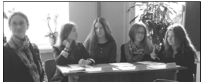
Protų mūšis „Kraštas, kuriame gyveni“